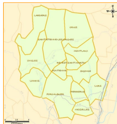
Les communes membres De la communauté de communes